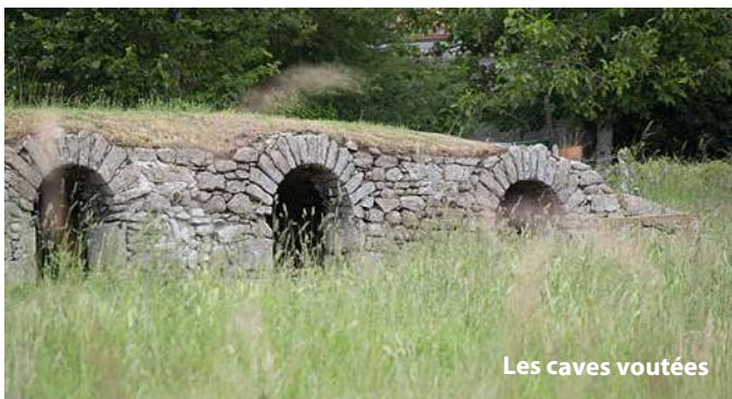
Les caves voutées

Sur ce parcours les chanoines auraient planté des ifs qui auraient plus de 800 ans.