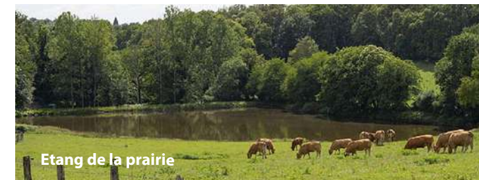
Etang de la prairie