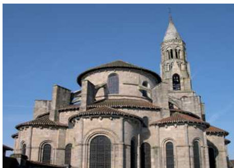
La collégiale de Saint-Léonard-de-Noblat