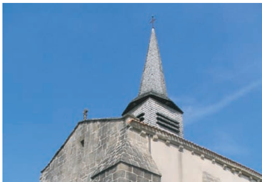
Eglise de Saint-Pardoux