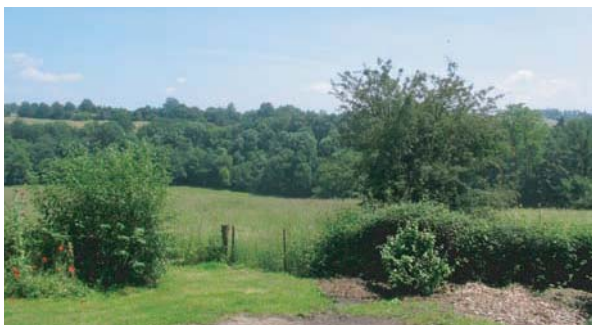
Vue sur la campagne limousine

Au passage, remarquez une fontaine dans un mur ainsi qu'un bac en pierre.