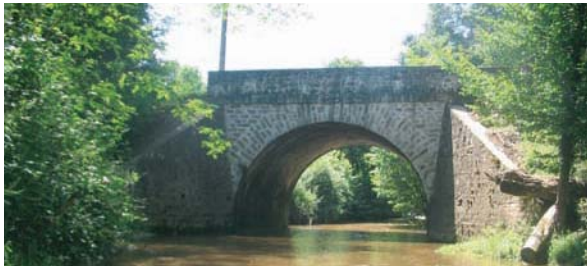
Pont sur l'Aixette