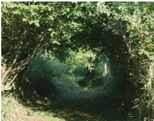
Un chemin creux

Tournez à gauche, suivez le chemin entre 2 murs de pierres sèches. Prenez à gauche puis à droite et continuez tout droit jusqu'à la route. L'empruntez à droite sur 200 m, tournez à gauche et suivez le sentier à travers les prairies. Rejoignez le village de Chenevières et le point de départ.