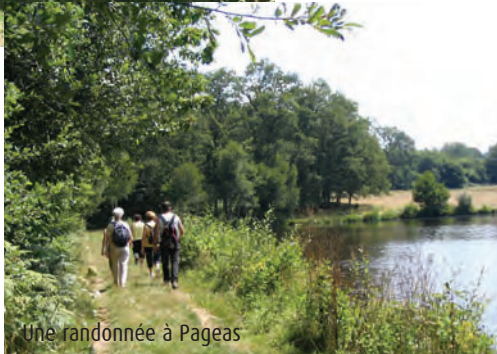
Une randonnée à Pageas