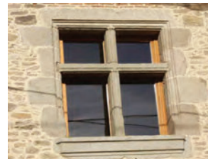
Fenêtre à meneaux à Chenevières